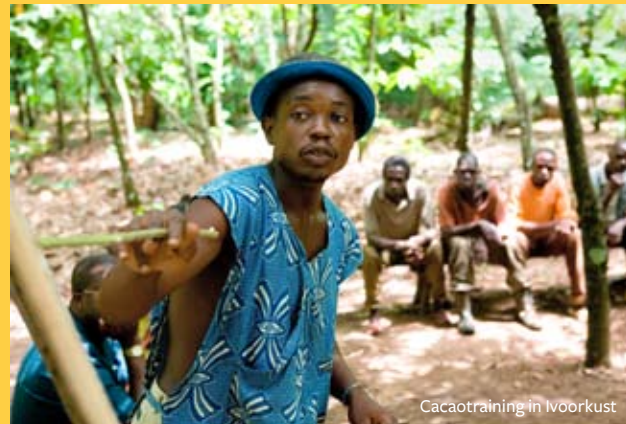
Cacaotraining in Ivoorkust

Stop de machtiging zo in de brievenbus of stuur hem in een envelop (zonder postzegel) naar Solidaridad, antwoordnummer 9741, 3500 ZH Utrecht. Met één telefoontje kunt u de machtiging wijzigen of stoppen. Wanneer u Solidaridad steunt, informeren wij u over ons werk. Als u daar geen prijs op stelt, kunt u dit hier aangeven. Ik wil geen informatie van Solidaridad ontvangen.